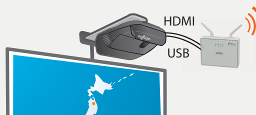
教室既設大画面TV, 電子黒板, 超短焦点プロジェクタ