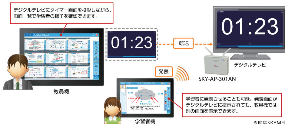
※図はSKYMENUClass2015での活用イメージです

デジタルテレビ等にタイマー画面を投影しながら、手元のタブレット端末で別の作業、例えば教員機で画面一覧を表示して、学習者機の作業を手元で確認するといった活用が可能です。もちろん、ミラーリングによる教員機画面の投影も可能です。