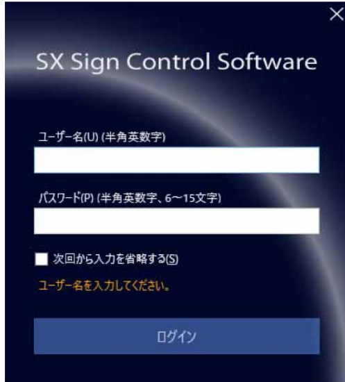
ユーザー登録後のログイン画面