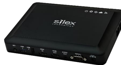
新製品 デジタルサイネージプレイヤー ST-700

今までのサイネージビジネスは継続し成長していきます。しかし、COVID-19の影響によりソーシャルディスタンス・無人対応・注意喚起など新たなデジタルサイネージ技術が生きる映像ビジネスチャンスが広がっています。