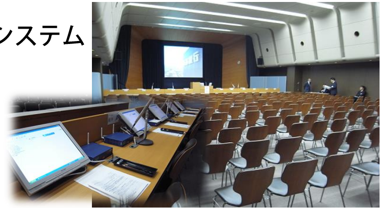
株主総会システム