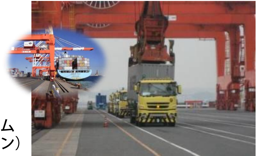
港湾荷物搬送システム (ガントリークレーン)