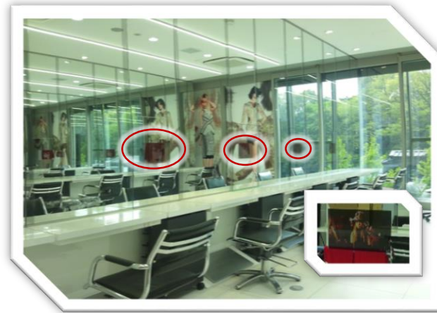
某美容室チェーン