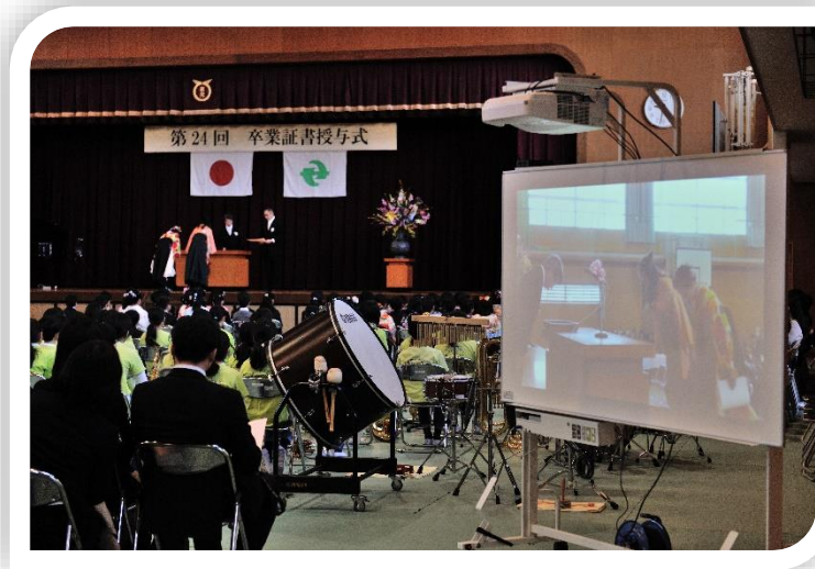
京都府内某小学校卒業式

神奈川県内某市全教室 北海道内某市一部小学校・中学校 N大学付属高校 某県教育研究所（教員研修） 兵庫県某市教育センター