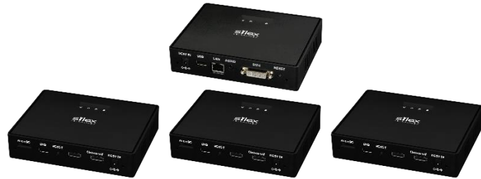
校内デジタルAV放送システム MV-500