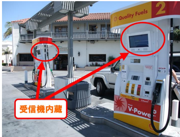
2008年～ GS向け内蔵製品 (米国・オーストラリア)