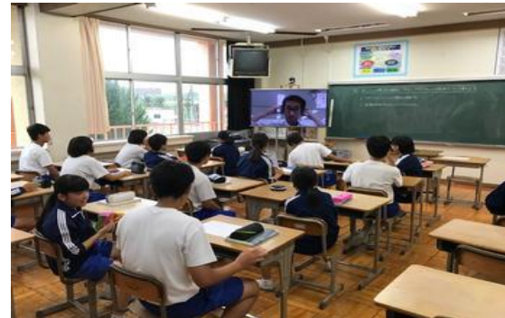
複数教室を使った密を避ける授業