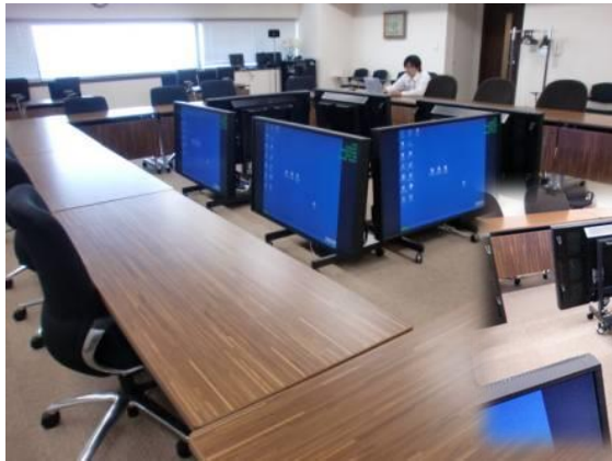
役員会議システム