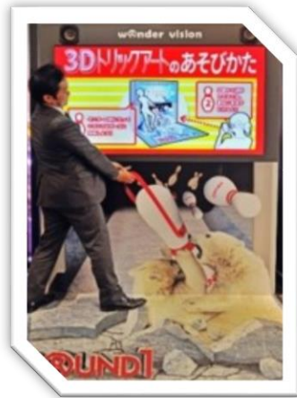
複合型アミューズメント施設