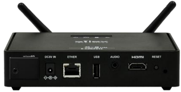
ワイヤレスサイネージプレイヤー X-5HM