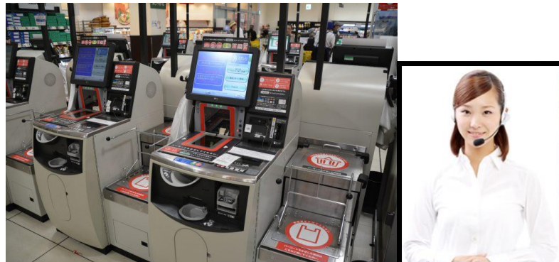
無人レジの増加とリアルタイムオペレータシステム

今までのサイネージビジネスは継続し成長していきます。しかし、COVID-19の影響によりソーシャルディスタンス・無人対応・注意喚起など新たなデジタルサイネージ技術が生きる映像ビジネスチャンスが広がっています。