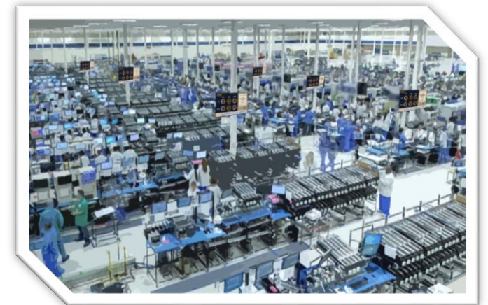
大型工場 アンドンシステム