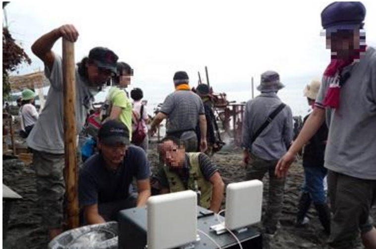
某大河ドラマ 撮影現場採用