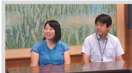
備前市立 片上小学校