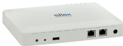
学校環境用無線 LAN アクセスポイント 『AP-501AC E model』