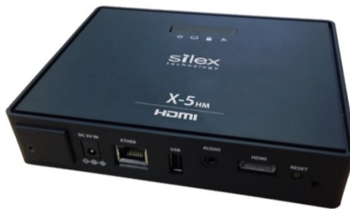
ワイヤレスデジタルサイネージプレイヤー『X-5HM』

サイレックスは既に自社開発のワイヤレスネットワークと画像伝送用途に最適化した JPEG XR 圧縮をコア技術とし、映像・音声コンテンツの同期配信機能を特色とする Multicast Distribution System『X-5』を販売しています。新製品の『X-5HM』は、『X-5』に搭載されている映像・音声再生機能(ストア&プレイ機能)を強化し、無線 LAN を使ったコンテンツ更新や、コンテンツ格納用 SD メモリの搭載、また複数コンテンツ表示を可能にする4画面分割やテロップ表示機能を追加しました。拡張したサイネージスケジュール作成・コンテンツ変換ソフト「Media Transporter 2」(無償)と合わせて利用することで、中小規模のデジタルサイネージで必要とされるセットトップボックス機能を廉価で提供します。