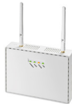
図3 Network Display Adaptor 『SX-ND4050G』