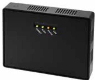
&lt; SX-ND2000F &gt;

急速に高まる高速無線の需要にあわせ、サイレックスは今後も IEEE 802.11n の高速無線通信に対応した製品のラインナップを拡大していく予定です。