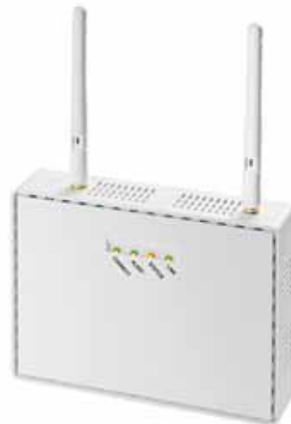
&lt; SX-ND4050G &gt;