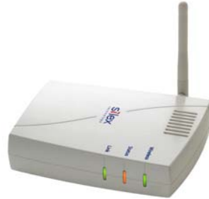
Wireless Bridge SX-2500CG

ソニーマーケティング(株)の販売するコンパクトなオールインワンモデルのビデオ会議システム『PCS-TL33』、『PCS-TL30』は、遠隔地とのビデオ会議を手軽に行える少人数・パーソナル向けのビデオ会議システムとして、お客様から非常に高い評価を得ています。その手軽さとは、ビデオ会議システムを行うために多くの周辺機材を必要とせず、また製品のコンパクト化により、最小限のスペースにてビデオ会議システムを利用できることや、モバイル性に優れている点などです。